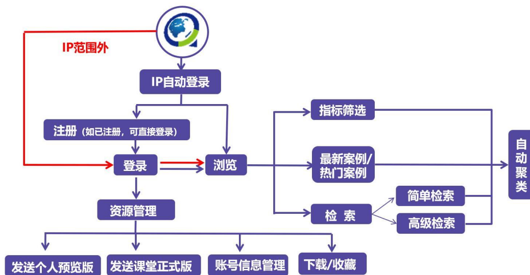
“全球案例发现系统”使用流程图